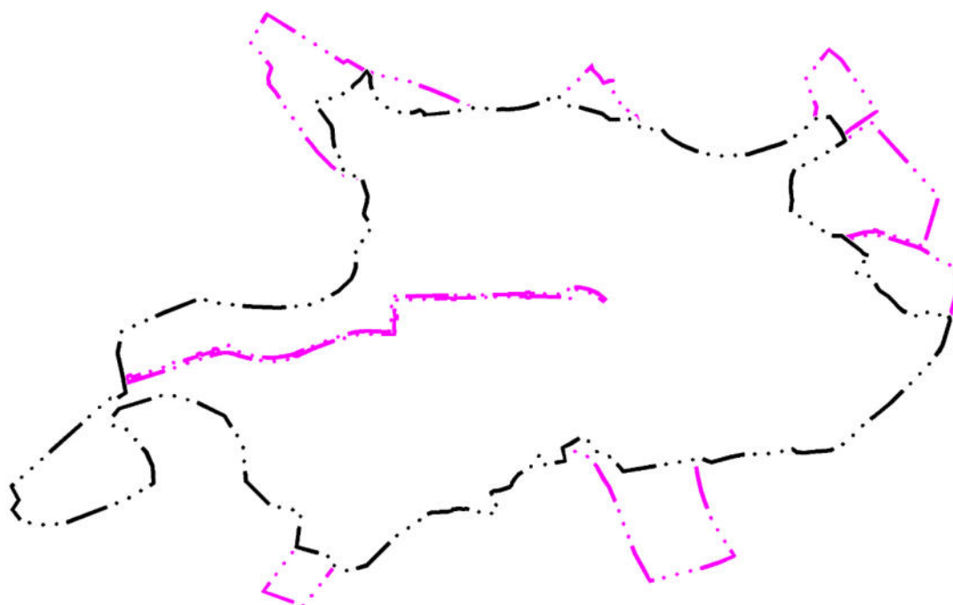
Рис. 1. Предложение по изменению границ населенного пункта Белоярского сельского поселения с. Тегульдет

Графические материалы в новой редакции прилагаются согласно составу проектных материалов, приведенному выше.